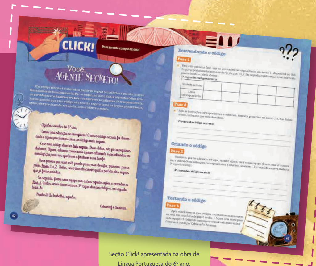
Seção Click! apresentada na obra de Língua Portuguesa do 6º ano.

A Coleção Asas , dedicada ao Ensino Fundamental – Anos Finais, traz situações didáticas relacionadas à BNCC Computação que são ofertadas, especificamente, na disciplina de Língua Portuguesa, por meio da seção Click!. Idealizada para o trabalho em grupo e com duração de uma aula, esta seção é apresentada de forma integrada e contextualizada ao conteúdo didático contemplado nos capítulos em que está inserida.