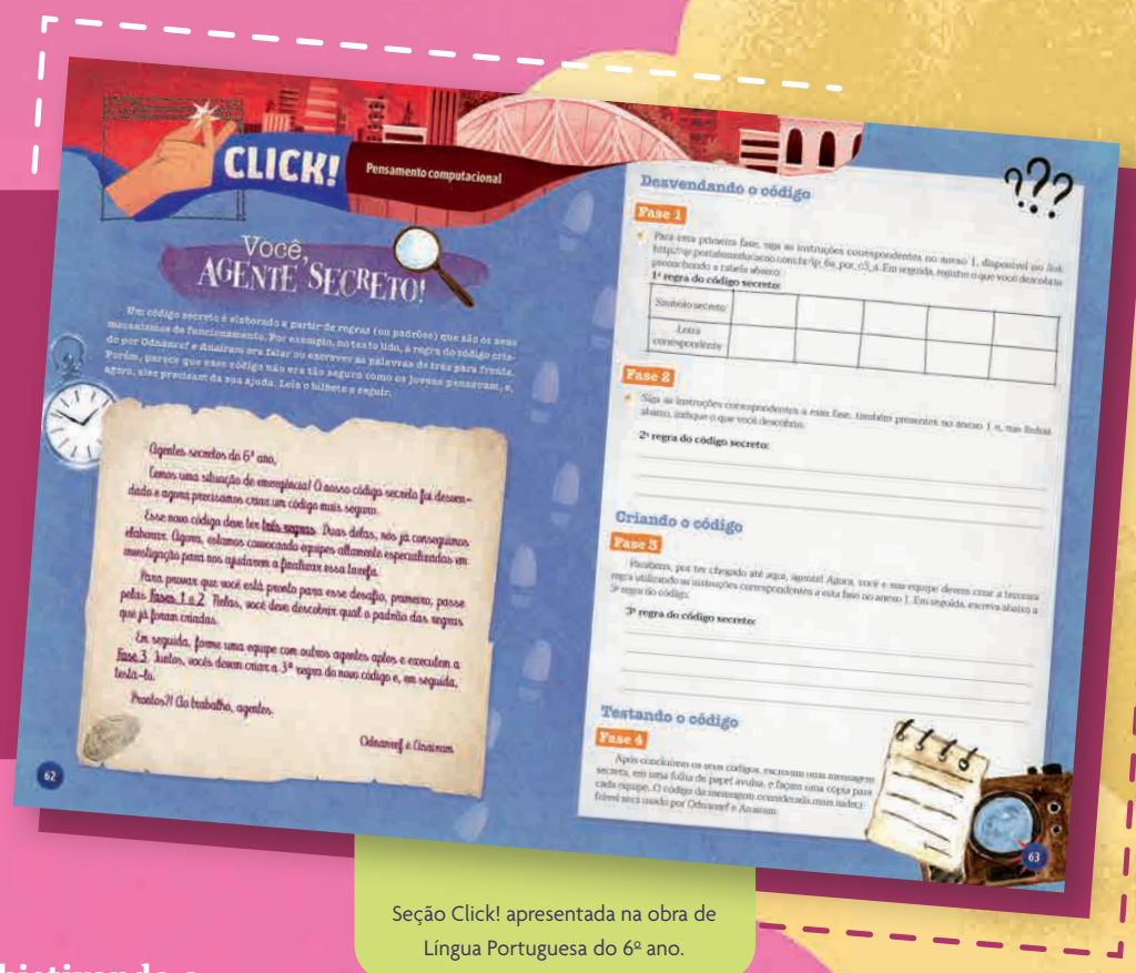
Seção Click! apresentada na obra de Língua Portuguesa do 6º ano.

A Coleção Asas , dedicada ao Ensino Fundamental – Anos Finais, traz situações didáticas relacionadas à BNCC Computação que são ofertadas, especificamente, na disciplina de Língua Portuguesa, por meio da seção Click!. Idealizada para o trabalho em grupo e com duração de uma aula, esta seção é apresentada de forma integrada e contextualizada ao conteúdo didático contemplado nos capítulos em que está inserida.