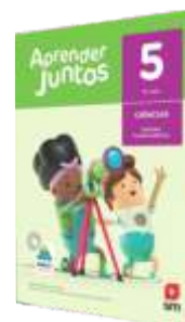
APRENDER JUNTOS CIÊNCIAS 5º ANO ENSINO FUNDAMENTAL ORGANIZADORA: EDIÇÕES SM, 6ª EDIÇÃO, 2017. EDITORA: SM