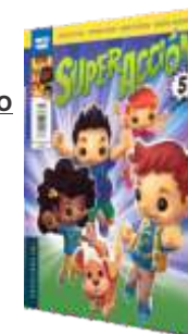
ESPAÑHOL SUPER ACCION – 5º ANO AUTORES: PRISCILA VIEIRA, FERNANDA BAIÃO, SANDRA PEREIRA, VANESSA INGEGNERI EDITORA: EDELVIVES -1ª EDIÇÃO 2018