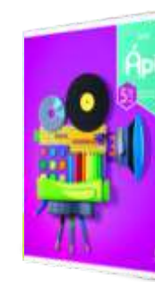
PROJETO ÁPIS ARTE 5º ANO AUTORES: ANDRÉ VILELA ELIANA POUGY EDITORA: ÁTICA, 1ª EDIÇÃO, 2017