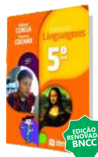
PORTUGUÊS LINGUAGENS 5º ANO EDIÇÃO RENOVADA BNCC AUTORES: WILLIAM CEREJA THEREZA COCHAR EDITORA: ATUAL, 7ª EDIÇÃO, 2019