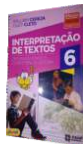
INTERPRETAÇÃO DE TEXTOS 6º ANO ENSINO FUNDAMENTAL I AUTOR: WILLIAM CEREJA - CILEY CLETO EDITORA: ATUAL, 2ª EDIÇÃO, 2017