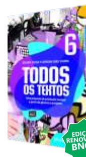
REDAÇÃO – TODOS OS TEXTOS EDIÇÃO RENOVADA BNCC AUTORES: WILLIAM ROBERTO CEREJA - THEREZA COCHAR MAGALHÃES EDITORA: ATUAL DIDÁTICO- 6ª EDIÇÃO, 2019